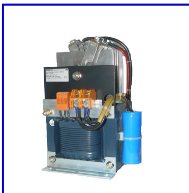
Einphasen-Netzgerät Schutzart IP00, T40/E Anschluss an Klemmen auf Fußwinkel stehend

Restwelligkeit 5% auch in weiteren Ausführungen lieferbar