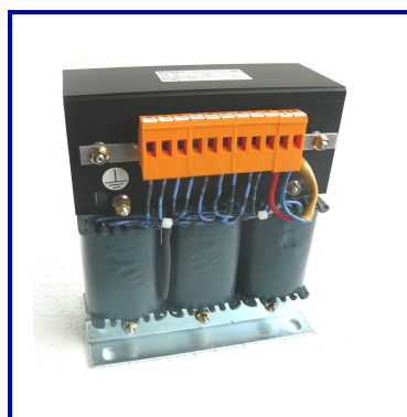
Drehstrom-Netzgerät Schutzart IP00, T40/E Anschluss an Klemmen auf Fußwinkel stehend

Restwelligkeit 5% auch in weiteren Ausführungen lieferbar