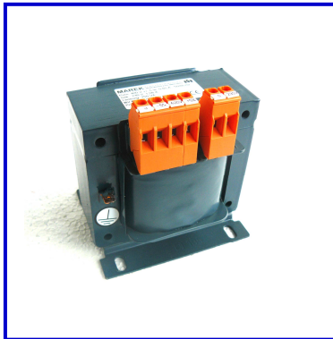
Einphasen-Transformator Schutzart IP00, T40/E Anschluss an Klemmen auf Fußwinkel stehend