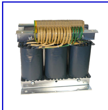
Drehstrom-Transformator Schutzart IP00, T40/E Anschluss an Klemmen auf Fußwinkel stehend